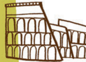
Roma S. II a.C.

Antes de ser un órgano de tubo, se llamaba HYDRAULIS y ¡se empleaba agua para que funcionara!