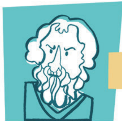
Aleandría S. III a.C.

Inventor del Hydraulis. Tatarabuelo del órgano